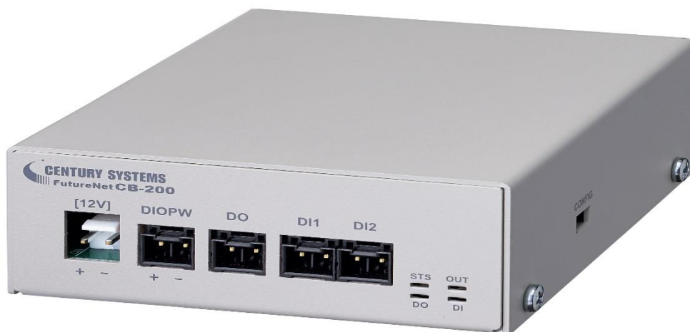
FutureNet CB-210 イメージ画像

FutureNet CB-210 は 2020 年 1 月 29 日(水)~31 日(金)開催の第 4 回関西 IoT/M2M 展(インテックス大阪 小間番号 14-30)にて展示を予定しています。