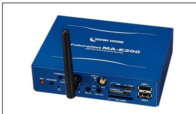
【写真 1: FutureNet MA-E250/FZ 】

FutureNet SA-120/Z は 32bit マイコンとリアルタイム OS を搭載した ZigBee の子機側デバイスです。様々なセンサに対応できるように豊富なインタフェースに対応しています。 SA-120/Z も同じ ZigBee 通信モジュールを搭載しています。センサを設置する拠点で必要となるデータ取得、データ保存、通信制御の機能を 1 台で実現できます。ソフトウェアはユーザが独自のアプリケーションを開発・導入できるように開発キットを提供します。