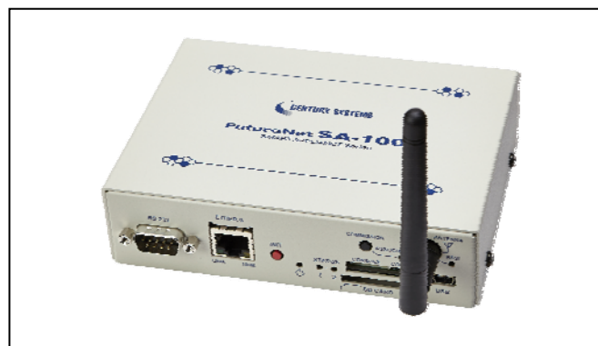
【写真 2: FutureNet SA-120/Z 】