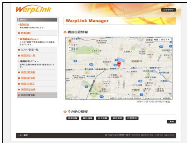
【図 2: WarpLink 管理サービス GPS(位置情報)表示画面】

これまでの死活・アダプタの状態(CPU/メモリ/通信状況)・ログ・設定情報の管理に加えてGPSによる位置情報管理の機能を追加いたしました。設置されたアダプタから送られてきたGPS情報をWarpLink管理サービスの画面から確認することができます。