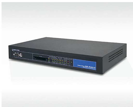
FutureNet XR-540/C : 中小規模の企業向け VPN ルータ

既に FutureNet XR-540/C をお使いのお客様については、ファームウェアのバージョンアップと「 サイトアンパイア 」のライセンス契約によりフィルタリングサービスが利用できます。ルータを買い換える必要はなく、手軽に本格的な URL フィルタリングをご利用いただけます。