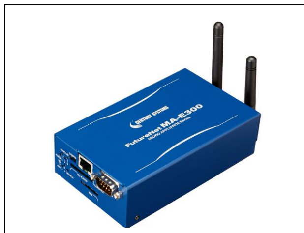
【写真 2. FutureNet MA-E360/N】